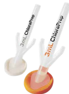
ChloraPrep® 3mL con y sin tinte