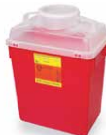
BD™ Sharp Collector