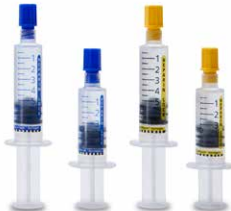
BD PosiFlush™ Heparina