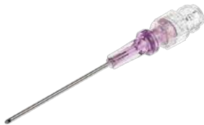
BD™ Blunt Filter