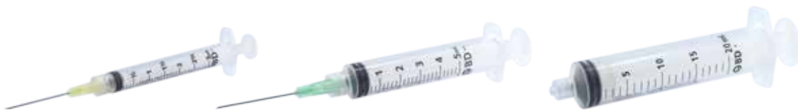
Jeringas BD Plastipak™