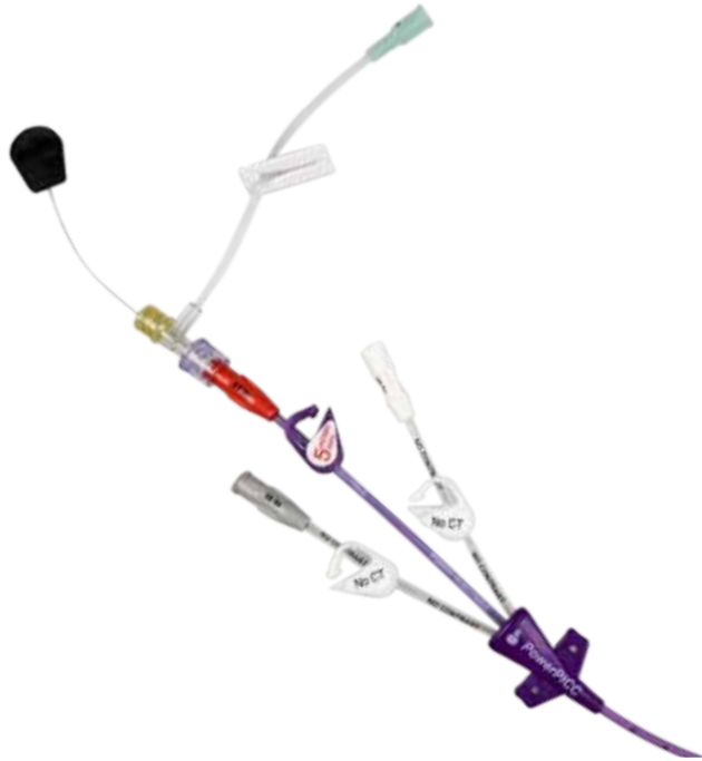
Power PICC® The universal PICC

*Caudal de flujo por gravedad, solución salina normal estéril y flujo a un metro de altura.