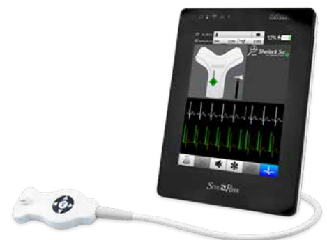
Ultrasonido Site-Rite® 8