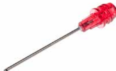
BD™ Blunt Fill