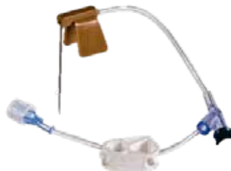
Agujas Bard® Non-Coring