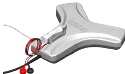
Sensor Sherlock 3CG® TCS