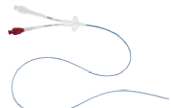
PICC NXT Groshong™